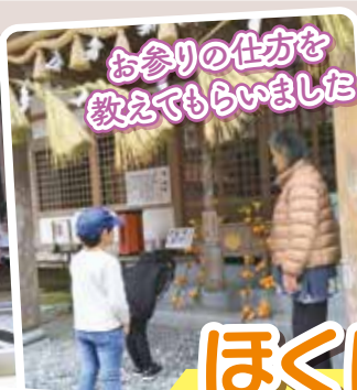
お参りの仕方を 教えてもらいました