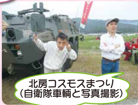
北房コスモスまつり (自衛隊車両と写真撮影)