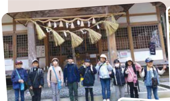
バスに乗って高岡神社へ